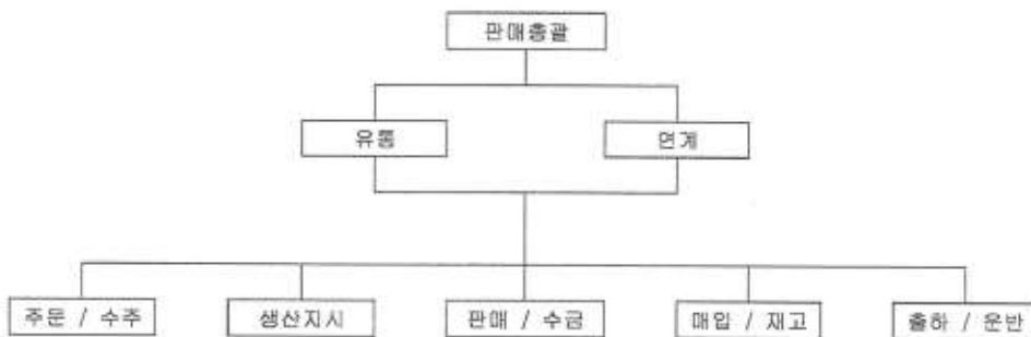
- 판매조직도 -